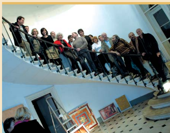
Eric Paillet / NR

Soutenus avec ferveur par un public conquis d'avance, les Niortais remportent brillamment le match.